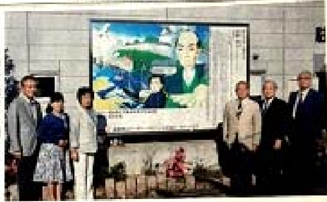
銘板を除幕した関係者