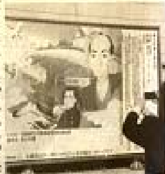
平塚高誠の安藤信正を紹介す る看板(1号)の色紙制作中

古里の偉人を知ってもら おうと、1号目いわき 駅前ビル、東の駅前草津王 ・安藤信正ペリーロータ リーの生誕を紹介する看板 が近日見えた。