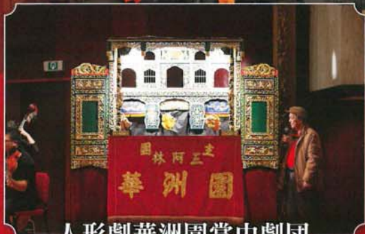
人形劇華洲園掌中劇団