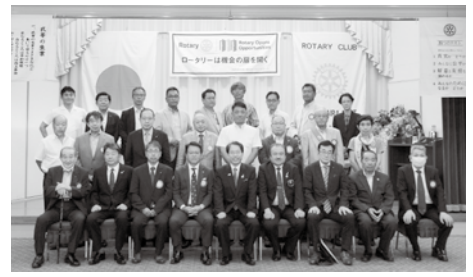
8月26日 ガバナー公式訪問

そこで、本年度の活動方針・目標は、第一にクラブの充実を図るため、例会・各種会合への出席者の純増・出席率向上、そのための外部卓話を中心とした魅力ある例会の設営・実施であり、さらには活発な各委員会の活動です。第二にはロータリークラブの公共イメージ・PRを図りクラブ会員の増強を進め、そして会員の退会者を無くすことです。第三にマイロータリーへ全ての会員が登録済ですが、本年度はログインして活用したいと考えます。更には、オンラインでの会議、セミナー等が考