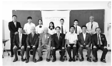
8月19日 ガバナー公式訪問