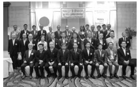
9月11日 ガバナー公式訪問

また、地区の重点目標、運営方針「Participate and Enjoy ROTARY」をもとに、「会員増強と退会防止」「例会出席率の向上」「会員親睦事業の開催」