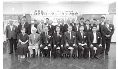
8月27日 ガバナー公式訪問

東日本大震災から10年を迎えようとしております。いわき平ロータリークラブでは「苗木forいわき」プロジェクトと協力して津波被害にあった海岸林の再生活動を続けています。本年度も