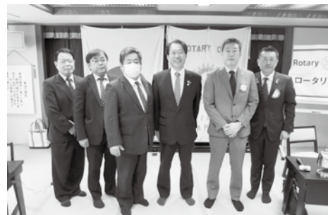
9月10日 ガバナー公式訪問