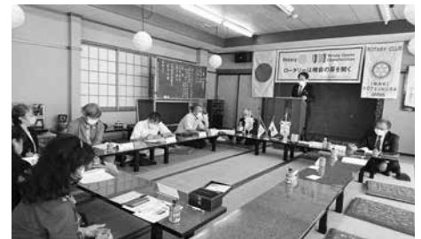
9月3日 ガバナー公式訪問