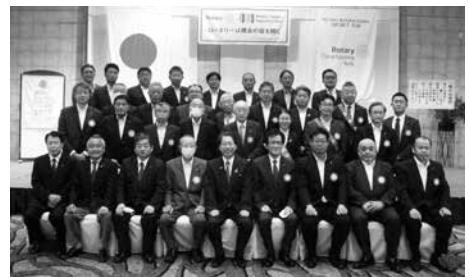
9月1日 ガバナー公式訪問

ジを向上させよう 6. ロータリー賞へ挑戦しよう 7. クラブ創立60周年に向けて準備を進めよう 7項目を掲げさせて頂きました。基本方針のもと58年目も大事に受け継ぎ、さらに60周年へ向けての礎となるべく精進して参ります。どうぞよろしくごお願い致します。