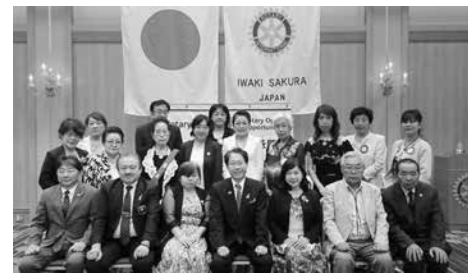
9月3日 ガバナー公式訪問

動するという素晴らしい力を持っています。だからこそ、今、この時、皆で行動しよう!