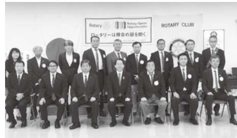
9月8日 ガバナー公式訪問

さて、今、世界も日本も、新型コロナウイルス感染症の拡大で、新しい社会生活へと急速に変化しています。当、梁川ロータリークラブも、そういう時代の流れに対応しながら今までの先輩諸氏が築いてきた伝統や気風を大事に