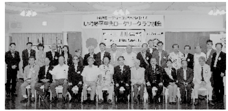
8月28日 ガバナー公式訪問