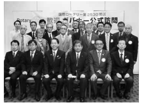
9月2日 ガバナー公式訪問

最後になりますが、できうる手法を模索し、皆様のご協力を頂きながら地域とクラブがより良い1年になります様、努力しますのでご指導宜しくお願い致します。