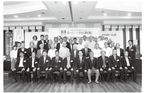
8月25日 ガバナー公式訪問

そして、ロータリアンの行動規範である「個人として、また事業において、高潔さと高い倫理基準をもって行動す