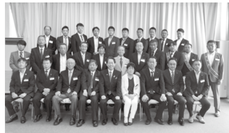
9月9日 ガバナー公式訪問

なで増強に取り組みます。すでに2名の増強を達成しました。あと3名の増強を目指し頑張っています。そして、当然のことながら退会防止にも力を入れていきます。