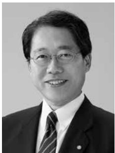
国際ロータリー第2530地区 2020-21年度ガバナー