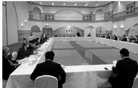
7月29日 ガバナー公式訪問

「奉仕しよう みんな人生を豊かにするために」のもと、ロータリーの根底に流れる「思いやりのこころ」をもって、コロナ危機の社会の中で「私達に出来ること 私達が目指すもの」を本年度一年考えながら活動し、例会や事業を展開し