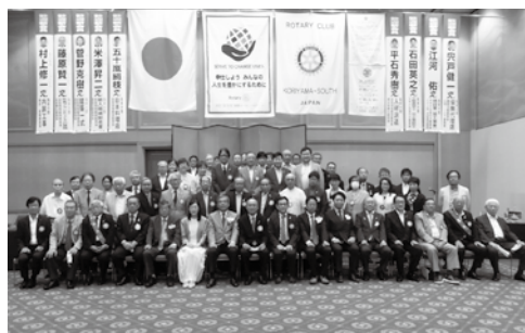
7月15日 ガバナー公式訪問

我がクラブは現在会員90名であり、女性会員も13名在席しています。会員は例会や委員会活動のみならず、ゴルフ愛好会、遠足クラブ、詩吟愛好会、そして合唱団などの活動を通して、親睦を深め