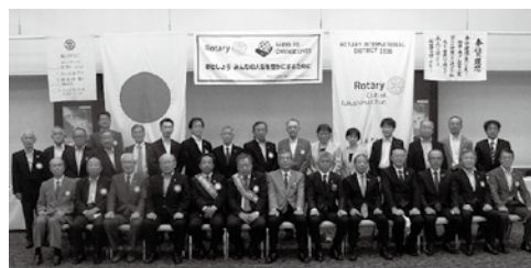
8月4日 ガバナー公式訪問