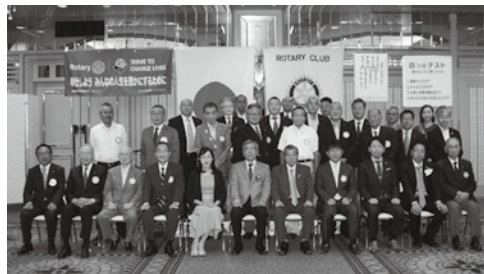
7月14日 ガバナー公式訪問

新型コロナウイルス感染症の拡大は、依然として猛威を振るい社会生活や経済に深刻な影響を及ぼしております。また、地震や気候変