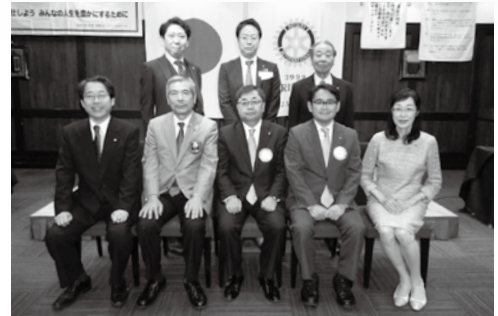
7月8日 ガバナー公式訪問

郡山ロータリークラブの根幹は、例会等の出席を通じ会員相互の親睦を深めることを第一義とし、それにより気づき学んだことを会員の皆様がそれぞれ個人として職業及び日常生活において奉仕の理論に基づき実践していくということであり、それこそが郡山ロータリークラブ