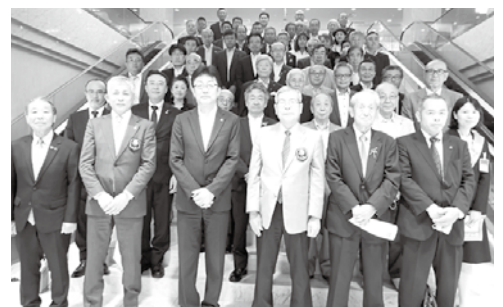
7月28日 ガバナー公式訪問

ロータリーの目的では奉仕の理念を奨励し、とされていますが奉仕の理念は会員の数ほどあるはずで、今年度は多くの会員に自らの奉仕の理念を語っていただきます。多くの会員が例会でスピーカーとなり、出席する例会から参加する例会にしていきたいと思っております。