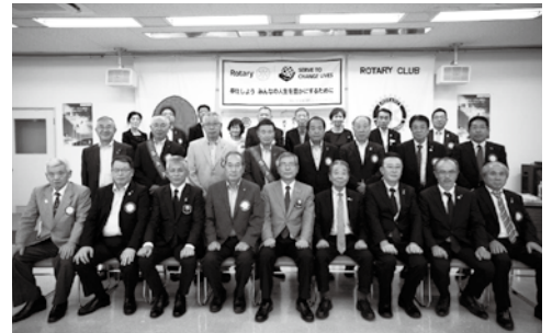
8月5日 ガバナー公式訪問

目標達成と維持を会長の申し送り事項 として継続しております、そのためにも より良いクラブ運営が求められていま す、各委員会が活発に活動できる環 境作りをしまります。