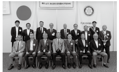
7月26日 ガバナー公式訪問

今年度のスローガンとして、「参加しよう!!例会に、楽しもう!!例会を」を掲げさせていただきました。現在、会員増強が最大の課題となっておりますが、誰もが参加する例会に魅力がなければ、なかなか入会していただけません。また、現会員の方々もただ例会に出席しているだけでは魅力あるクラブにはならないと思います。そこで、今年度は会員スピーチを増やし、ロータリーのこと、職業のこと、自分の経験談などいろいろなテーマでスピーチしていただくということを一つの案として考えております。その話から新たな活動等が生まれるきっかけにしていきたいと思っております。小さなことでもアイデアを出し合い、この福島西ロー