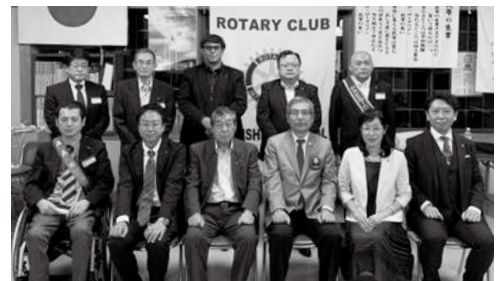
7月12日 ガバナー公式訪問

リモート会議については、厳しいご意見もありますが、当クラブは、リモート会議の利点