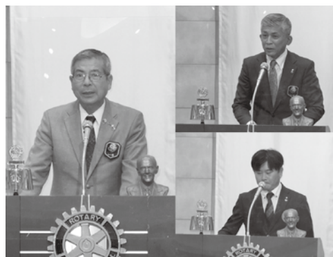
7月29日 ガバナー公式訪問

この度、福島21ロータリークラブ21代会長を仰せつかり、その責任の重さに身の引き締まる思いです。当クラブは20周年を迎え、人でいえば成人という大事な時期を迎えました。今年度は今後のクラブ運営の未来に向けて大切な年度です。新型コロナウイルスの影響で通常のクラブ運営が難しい場面も想定されますが次なるステージに向けてのクラブ運営に努めたいと思っています。人と人の関わり方（距離感）の変化で人間関係が希薄化されている現状ですが、人と人のふれあいの大切さを協働活動により再認識してもらいながら、今後の地域貢献活動につなげる取り組みを進め、地域とロータリーが協働することで、ロータリ