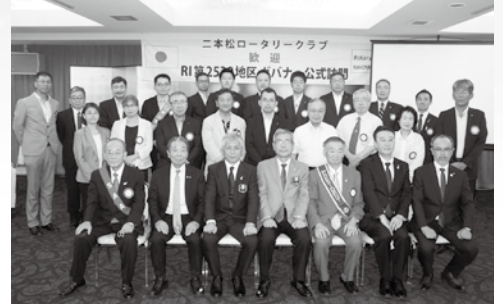
8月4日 ガバナー公式訪問

二本松ロータリークラブ創立60周年に 当り、テーマを『新化と継承』とし今年 度事業を遂行致します。1936年郡山RC 創立、1951年福島RC創立、10年後が二 本松RC創立であり恰好の時の道標とな ります。シカゴにて誕生し、東京RCの 国際ロータリークラブ承認の100年に当 たるのも不思議な一致です。創立60周 年を機に、本年度RIテーマ「奉仕しよう みんなの人生を豊かにするために」を 念頭に『新化と継承』への具体的事業と 致します。ロータリークラブの意義を 広く内外に知らせ、例会こそがロータ リークラブの存在意義であり、相互の親睦