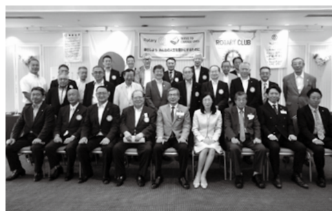
7月21日 ガバナー公式訪問

年行事を計画しており、今年度は会員増強に努め、絆がある楽しいクラブとなつて、周年行事が挙行できるよう、誠意をもって運営していきたいと考えております。