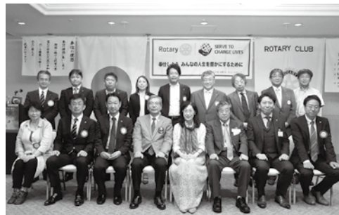
7月20日 ガバナー公式訪問

クラブのため会員のために何をすべきか、絶えず謙虚に、学ぶ姿勢を忘れず、会員一人一人の声に良く耳を傾け、クラブの人助けになれるように、幹事と共にクラブ運営に努めます。皆