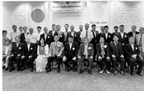
7月20日 ガバナー公式訪問