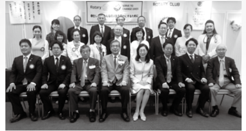
7月21日 ガバナー公式訪問

当クラブでは、長期の戦略計画がまだ存在しないため、戦略計画の立案をロータリー賞の目標の一つとして設定してお