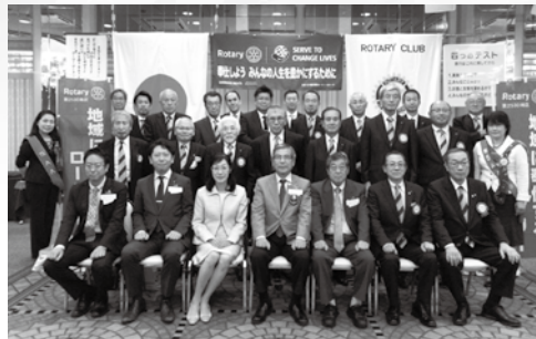
7月13日 ガバナー公式訪問

紹介することによって、ロータリーの活動への理解と認識が増し、入会への関心が高まると思います。活動を積極的に広報しましょう。