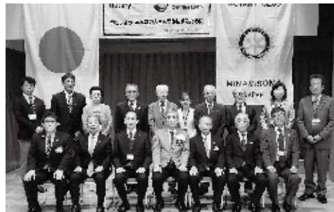
9月28日 ガバナー公式訪問

さて、今年度の当クラブ運営方針は、RI会長のテーマ「奉仕しよう みんなの人生が豊かになるために」をもとに相馬農業高校インターアクトクラブと連携し地域貢献活動を実施したいと考えています。また、地区重点活動目標を達成するためにも会員全員で取り組んで参ります。クラブのテーマは15周年を迎えた当クラブにおいて、更なる成長を遂げるため