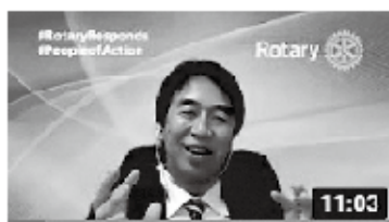
クラブ国際奉仕プロジェクト の懸け橋となる米山学友