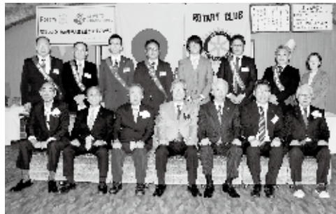
10月1日 ガバナー公式訪問

未だコロナ感染の終息が見えない現状で、今後様々なルールが変わり、ロータリー活動も新たな様式が求められる中、我がクラブでは、こんな時だからこそ「変革」（今だからこそできること）と「挑戦」（今やらなければならないこと）を実践します。例会の休会防止の為、Zoomでの開催を固定化し、会員の出席しやすい環境を整え出席率の向上と退会防止を図り、全会員のスピーチを行うことにより、親睦と友情を深め楽しい例会にする。ロータリー賞達成を目指し、活動目標数値を設定しますが、特に会員増強、奉仕活動への参加、親睦のための活動、奉仕プロジェクト、RYLA研修への参加に重点を置き活動していきます。