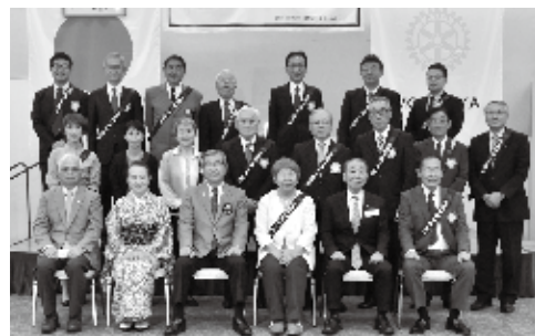
9月10日 ガバナー公式訪問

今期、地区運営方針・活動目標に沿ってクラブの運営方針を考えましたが、その他、過去の活動や個人的な活動、全く新しい事など、皆様の協力を得て何か始めたいと思います。SDGsにも積極的に関わりたい。SDGsの17の目標にはロータリーの今までの活動と重複しているものが沢山ありますね。特別なことではないのですね。