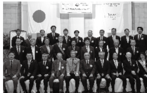
10月5日 ガバナー公式訪問

イメージを向上させましょう。 6, ロータリー財団への理解を深めましょう。 7, 創立60周年に向けて準備を進めましょう。 以上の基本方針より、委員会活動を行います。そして、楽しい魅力あるクラブづくりとロータリーライフを目指してまいります。コロナ禍の中で、新生活様式を実践し会員の安心安全を確保しつつ例会・事業を開催し、60周年へ向けて準備を進めてまいります。