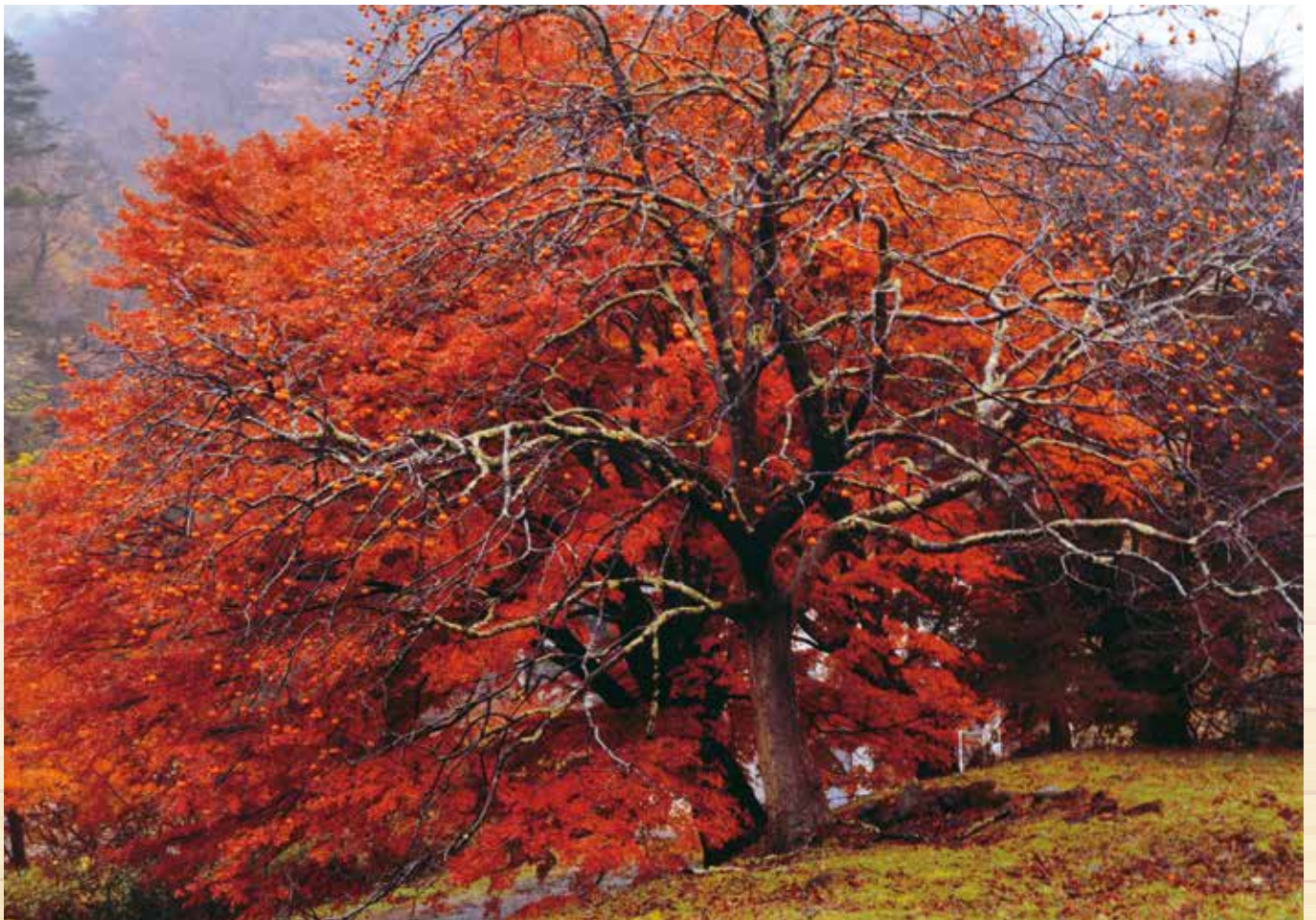
秋の風景（撮影：いわき小名浜RC 椎名悦雄）