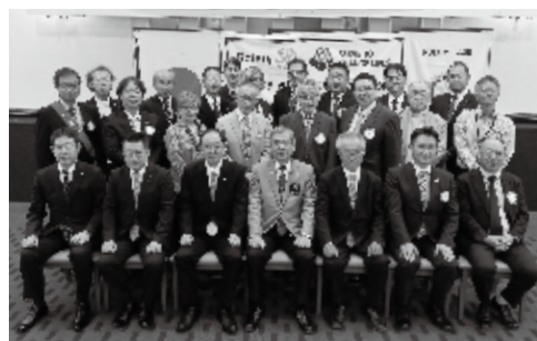
10月6日 ガバナー公式訪問