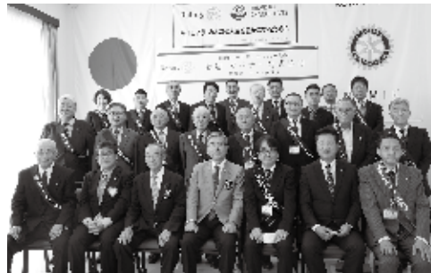
9月27日 ガバナー公式訪問

浪江、双葉、大熊、葛尾の、真の復旧復興、現状を正しく認識し、何をしなければならぬのかを考えてまいります。