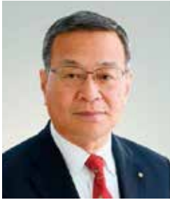
職業奉仕委員会 委員長