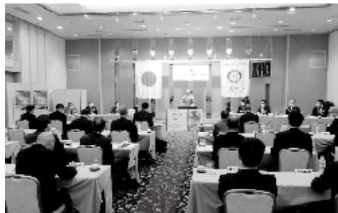
9月24日 ガバナー公式訪問

また、2030年までに持続可能なより良い世界を目指すSDGsへの取り組みが本格化するなど、日本は大きな社会変革の時期を迎えています。こうした社会変革に合わせて奉仕の形・質・規模・姿勢などを進化させることを推進し、同時に会員・家族・関係者の皆様との親睦を深化させ、会員増強・クラブ基盤の拡大につなげる所存でござ