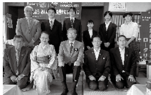
9月14日 ガバナー公式訪問

桁会員のクラブとして迎えられる様、鋭意取り組んで参ります。引き続き地元活性化に努める団体との連携を図りながら、ささやかな滝根ロータリークラブの灯を地域への奉仕実践として照らして参ります。