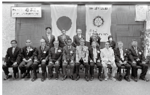
10月1日 ガバナー公式訪問