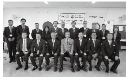
10月12日 ガバナー公式訪問

第一の目標に全会員に推薦者を募り、新会員加入に全力で取り組んでいきます。 ・継続事業である、やながわ希望の森公園への植樹と、学校への優良図書への贈呈をします。