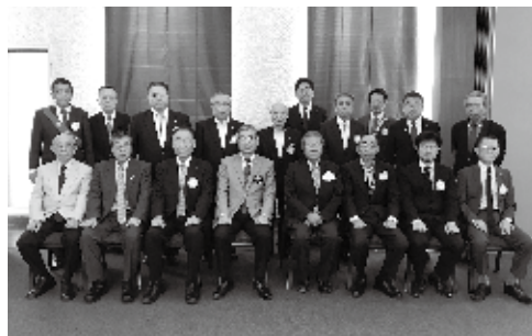
9月24日 ガバナー公式訪問

今年度、会津若松西ロータリークラブは、創立60周年を迎えます。2022年6月12日（日）会津大学に於いて開催の予定です。今年度会津若松西ロータリークラブの活動方針は、「ロータリーを楽しもう」楽しくなければロータリーではない。こんな方針を掲げてあります。ロータリーを楽しむには、まずはロータリーを知ることから始まります。そしてロータリーの魅力を知り、ロータリーを好きになり、そしてロータリーを楽しみましょう。この活動方針に沿って活動を進めていきたいと思ひます。人生道場と言われる例会を楽しく、自己研鑽のできる例会に、ためになる例会に、今日も