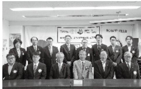
10月4日 ガバナー公式訪問

今年度はスタートから新型コロナウイルス感染拡大により様々な活動が制限されております。当クラブはオンライン例会を昨