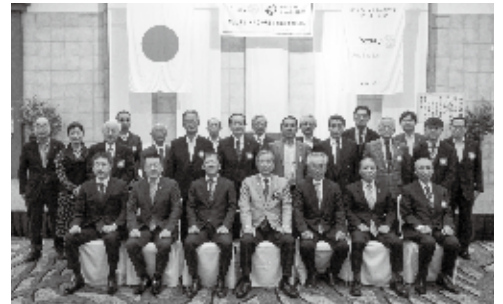
10月8日 ガバナー公式訪問

2021-2022年度 福島東ロータリークラブテーマに「変化を楽しもう」と掲げました。時代の移り変わりに伴い事業環境や生活環境が急速に変化する中、ロータリー活動にも変化や変革を求められています。そんな中、当クラブは優先課題としてIT化を積極的に進め、どんな状況下においてもクラブ内での情報共有や