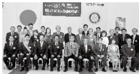
9月29日 ガバナー公式訪問

当クラブのモットーは「明るく、楽しく、元気よく」です。これを前面に出して会員増強や出