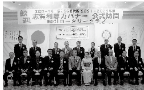
9月15日 ガバナー公式訪問

コロナ禍での行動抑制、自粛の中での活動制限テーマの後半部分のみんなの人生を豊かにするのはロータリアンとしての自覚と誇りをもって社会、地域とのかかわりを大切にして、慈愛の心を持ち生活していくことだと思います。その為には、仲間を増やし会員相互の親睦を深め、地域、日本、世界の人々に小さい奉仕から始め大