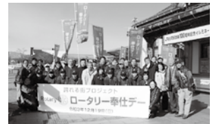
【白河西RC】白河駅周辺