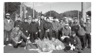
【石川RC】磐城石川駅周辺