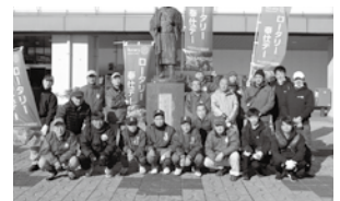
【白河RC】新白河駅周辺