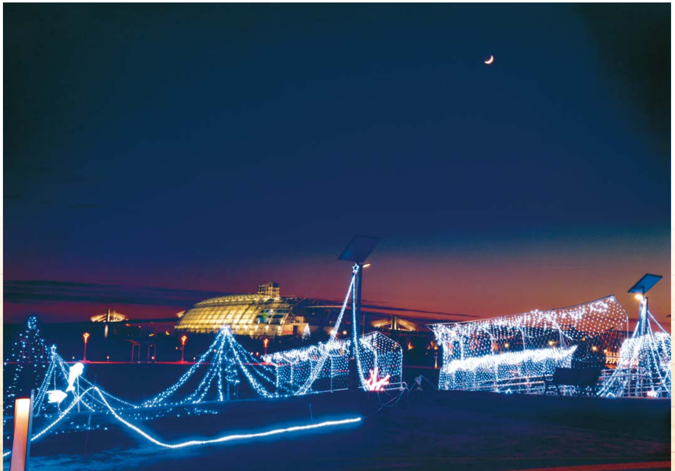
小名浜港のイルミネーション