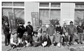
【須賀川RC】須賀川駅周辺