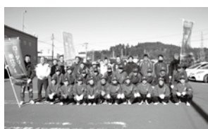
【東白川RC】磐城棚倉駅周辺