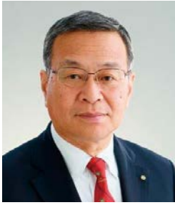
職業奉仕委員会 委員長