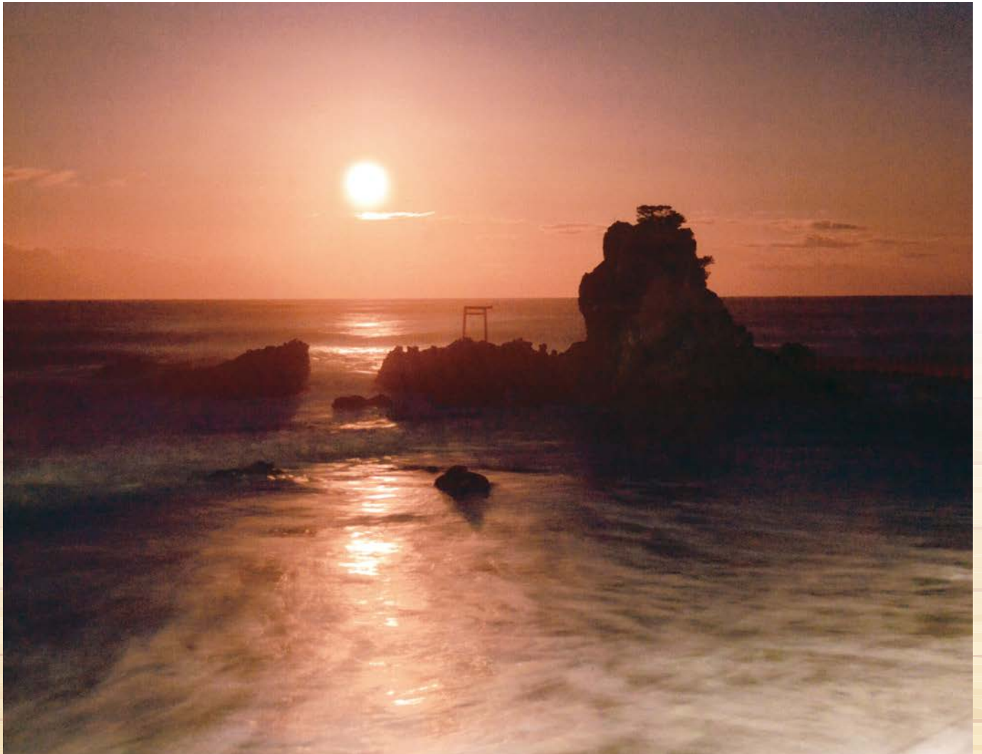
波立の「月」の出