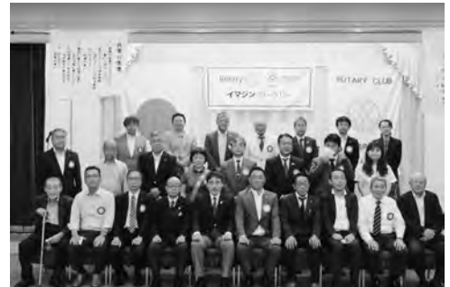
7月13日 ガバナー公式訪問

今年度は新型コロナウイルス感染症が終息に向かうと思ひ、各月活発な活動を予定しておりました。各月のコロナ動向を確認しながら、専門家のアドバイスを受けながら、感染対策をしっかりと行いながら、少しずつ会員相互の親睦を深め、各委員会の活発な活動を仰ぎ、奉