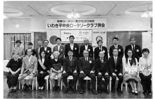
7月8日 ガバナー公式訪問

です。今までは難しいことでしたが、コロナ禍が生んだDXの発達。オンラインを駆使すればそれも難しいことではないはず。ぜひ、皆様方と繋がっていきたいのでよろしくお願ひ申し上げます。