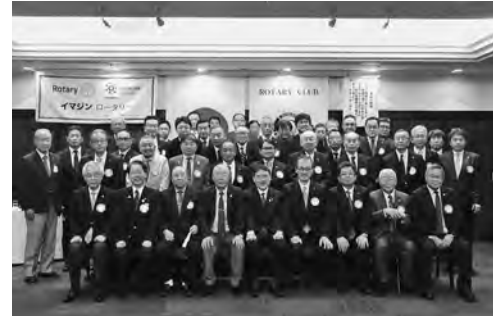
7月28日 ガバナー公式訪問

AGINE ROTARY」並びに、地区スローガン「情熱 行動 感動 共有」を深く理解し、DEIを取り入れ、公平で、多様性のある大人のクラブを繋いでまいりますので、1年間宜しくお願いいたします。