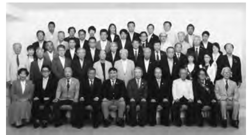
8月4日 ガバナー公式訪問

青少年支援も大切な活動です。今年度は子供の貧困問題（7人に1人）に注目し「子ども食堂」への支援