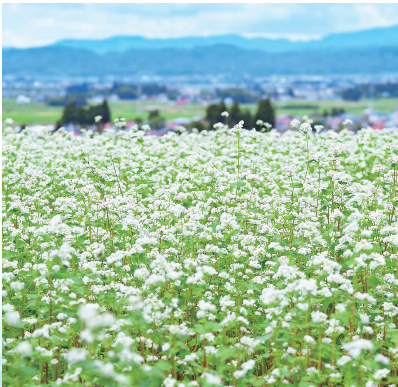
喜多方市 塩川町五合地区そば畑