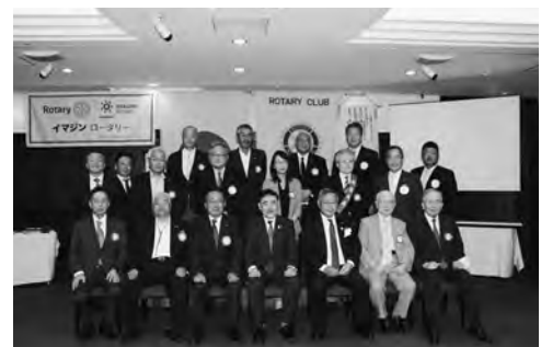
7月27日 ガバナー公式訪問

よって2022-23年度郡山西北ロータークラブの今年度の活動のテーマはローターソングにもある「奉仕の理想に集いし友よ！」へのチャレンジ！とさせていただきます。新たな継続的な奉仕活動への積極的な参加に取り組んで参ります。又、従来からクラブの重要な会員相互の親睦活動の促進、会員拡大にも委員会の皆様を中心に取り組んで参ります。