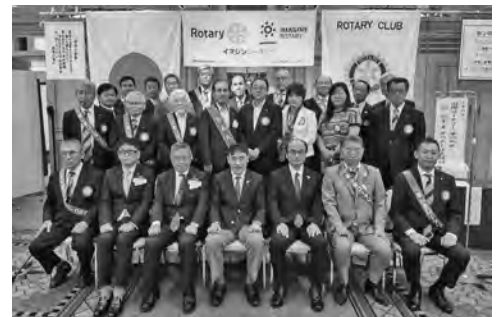
7月19日 ガバナー公式訪問

重ねてとなりますが、このコロナ禍で私たちの日常生活ばかりでなく世の中の価値観まで大きく変化してしまいました。アフターコロナを見据えて、先輩諸氏が築き上げてきた郡山東ロータリークラブの伝統を守りつつ、