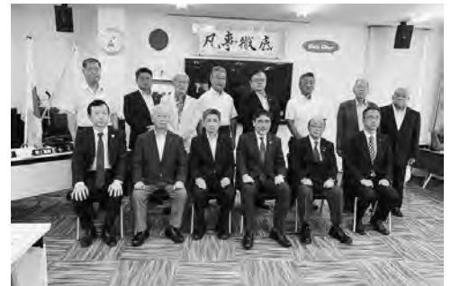
7月11日 ガバナー公式訪問

委員会活動をするのは難しいので、実情に合った委員会構成をして構わないとのご指摘を頂きましたので、当クラブにあった内容の伴った委員会活動が出来る様、見直します。