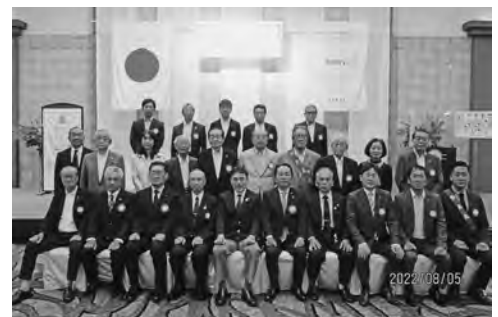
8月5日 ガバナー公式訪問

本年度はガバナー補佐輩出クラブとして地区の担当行事がありますので全員参加型によって開催したいものです。国際ロータリークラブ第2530地区、今年度地区スローガンに「情熱 行動 感動 共有」情熱（熱い想い）をもって行動し、感動（成果）を共有