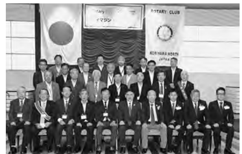
7月25日 ガバナー公式訪問

はゴルフ部会のみであります。ゴルフ以外の趣味をもつ会員も沢山おり、若い会員増強のためにも登山、キャンプ、ロードバイク等のサークルが作れば更なる親睦向上が図れると考え取り組んでまいりたいと思います。