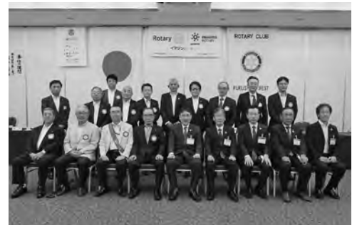
8月1日 ガバナー公式訪問

福島西RCは少数ながら25年に及ぶ伝統ある少年野球大会と麻薬撲滅運動に特化し、地区各クラブの皆様の御協力を仰ぎながら粛々と実行していく所存です。