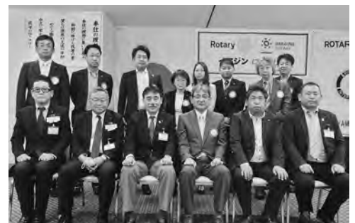
8月2日 ガバナー公式訪問