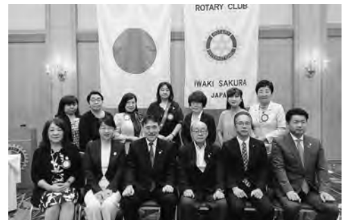
7月21日 ガバナー公式訪問

女性だけの小さなクラブですが、ここぞという時の一致団結力があります。運営上、幹事を始めとした会員全員のお力添えを頂きな