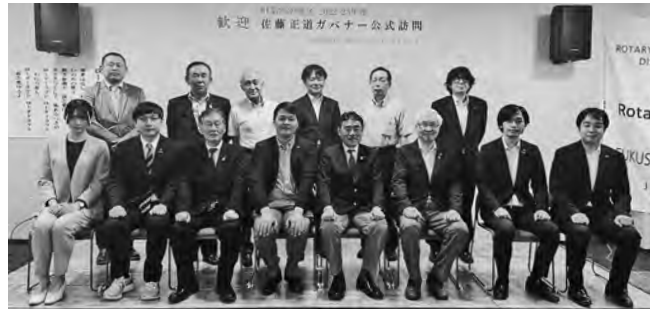
8月10日 ガバナー公式訪問

福島中央RAC会員の半数が今年度入会した事から私たちは言わば「赤ちゃん」クラブでもある。ロータリーやローターアクトについて知らない事ばかりの私