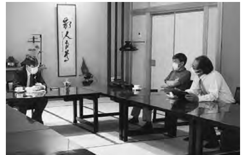
7月13日 ガバナー公式訪問