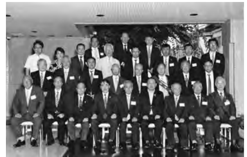
7月6日 ガバナー公式訪問

第2530地区佐藤正道ガバナーはこれを受けて地区スローガンとして「情熱、行動、感動、共有」を掲げました。以下がその内容です。「情熱（熱い想い）をもって行動し、感動（成果）を共有（共に分かち合う）しよう」また、地区重点目標として、1.*DEIを取り入れた会員増強拡大 2.よりインパクトのある奉仕事業の実践 3.活動の情報発信 4.ネットワークの構築 5.ボリオ撲滅を掲げました。この目標達成のため、当クラブの方針を次のように設定しました。1.DEIの考え方を取り入れた会員増強（会員数41名以上、女性会員加入）2.クラブ活動の情報発信として、ホームページ以外のSNSの活用 3.クラブ例会の活性化を図る（会員の卓話実践と外部卓話の