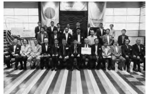
7月26日 ガバナー公式訪問