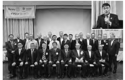
7月20日 ガバナー公式訪問

役になることが大切です。よって今年度の郡山西RCのスローガンを「一人一人が主役 みんなで盛り上がろう」としました。関係各位のお力をお借りして、「盛り上げて」いきますのでよろしくお願いいたします。