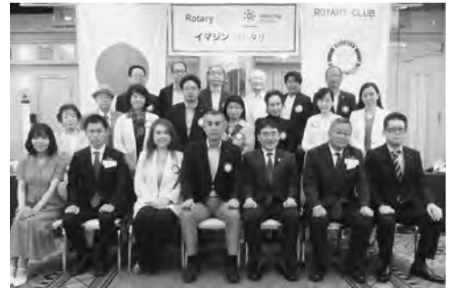
8月3日 ガバナー公式訪問

コロナ感染が日本中に蔓延している中のスタートとなりました。今年度から例会場をベルヴィ郡山に、また例会日を火曜日に変更となりました。今年度はコロナ感染を注視しながらリアルでの開催を目指します。会員同士及び会員家族が楽しめるような親睦を中心に活動していきます。更なる友情とコミュニケーションを深めていけるようなプログラムを推進します。ロータリーを更に理解するにはマイロータリーを活用しなければならなくなっています。加入促進とその利用方法を勉強していきます。又地区主催のセミナーも大事になってきています。会員の出席を促します。親睦と学びはとても重要だと思えます。昨年示された『アーバンRCのビジョン声明』の会員増強を全会員で進めていきます。コロ