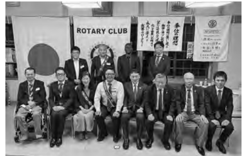
7月25日 ガバナー公式訪問