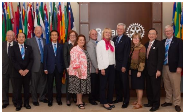
(写真:平和のための大口寄付推進計画委員会研修会合 2018年9月世界本部)

平和のための大口寄付推進計画委員会は、ロータリー財団管理委員会に置かれた委員会で、ロータリー平和センターのロータリー平和フェロシップならびに重点分野の「平和と紛争予防／紛争解決」のため、大口寄付の推進をしております。